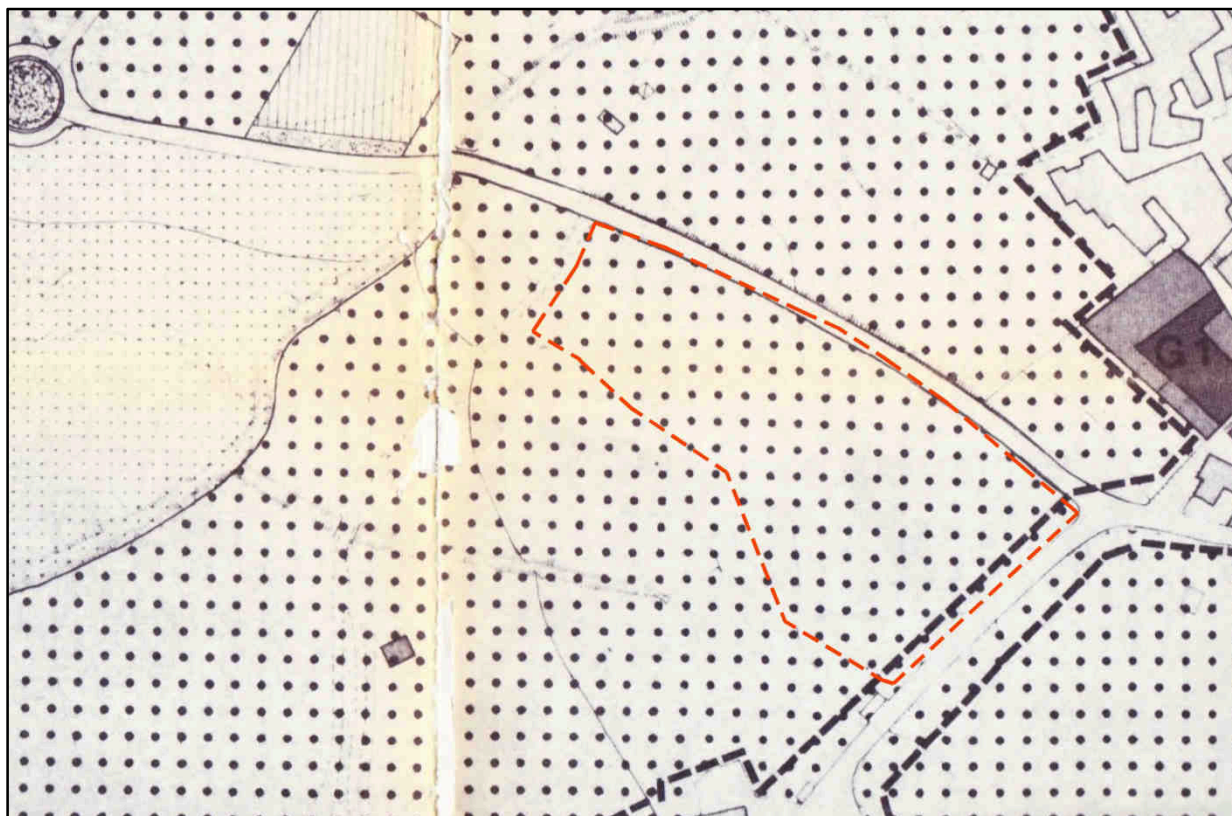
Stralcio del P.R.G.